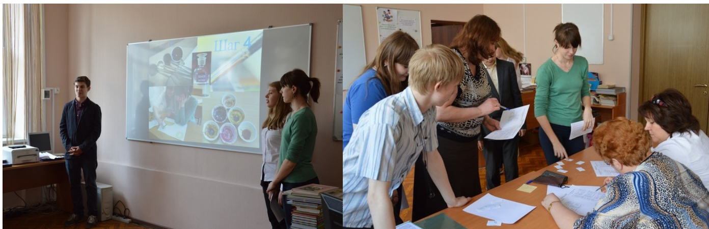
Работа секций: «Малая академия наук» (1-5 классы)